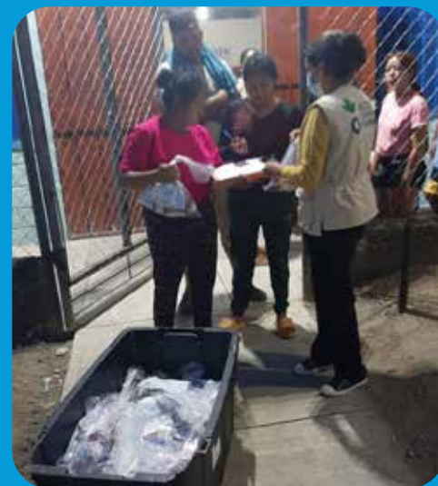
Entrega de kits de higiene personal en el CDT Carlos Roberto Reina, en Trojes.