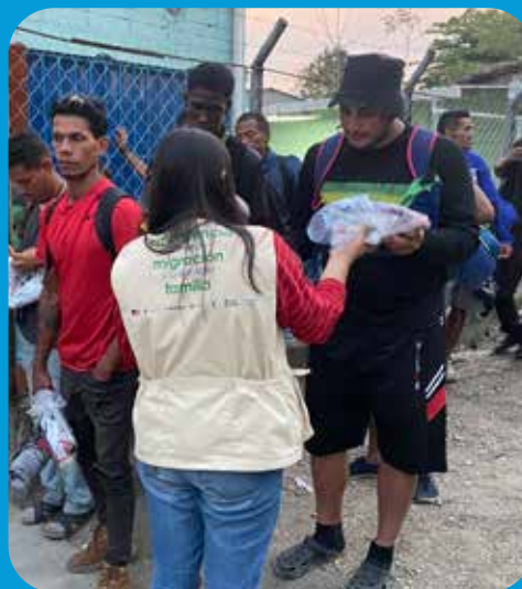
Entrega de kits de alimentos en el CDT Carlos Roberto Reina, en Trojes.