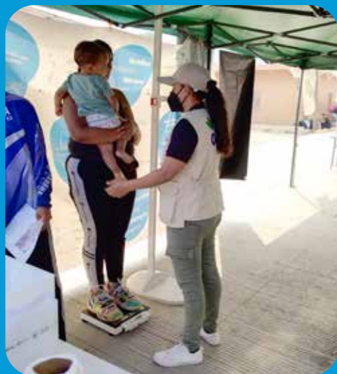
Revisión médico nutricional para madres con sus hijos menores de 5 años CDT Carlos Roberto Reina, en Trojes.